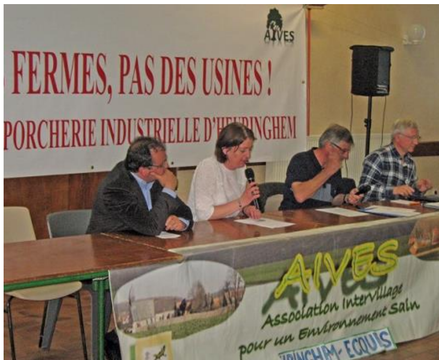
La tribune de la 5 ème AG

Cette 6 ème Assemblée Générale Ordinaire sera précédée d'une Assemblée Générale Extraordinaire qui proposera de nouveaux statuts pour une modification de la gouvernance d'AIVES et un élargissement de son périmètre d'action.